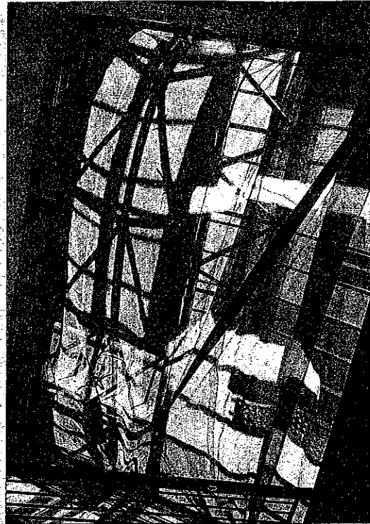
Tragaluz por donde cayó el trabajador accidentado.

Hay que destacar que (siempre según la versión de las primeras personas que acudieron a socorrer al accidentado) éste no disponía de ningún tipo de arnés ni sistema de seguridad, por lo que se podría deducir (siempre a la espera de lo que finalmente se desprenda de la investigación de la policía judicial), que, efectivamen-